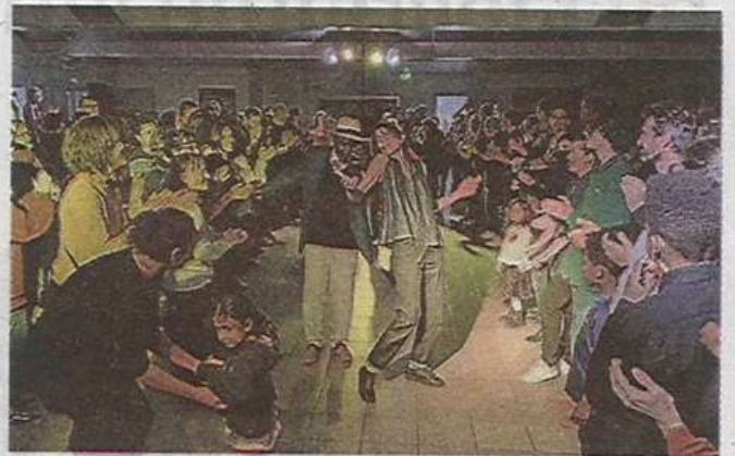
Ce bal populaire a été un vrai succès auprès des habitants du quartier.

Seul ou à deux, rock ou salsa (du démon), thé dansant ou boîte de nuit, les univers et époques se sont mélangés jusqu'à former une longue farandole. Les générations se sont confondues dans une transe joyeuse et